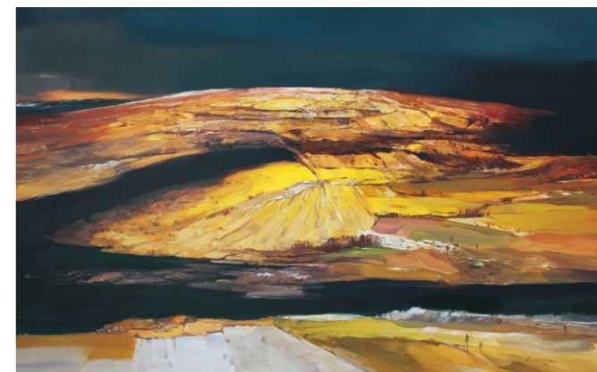
龚浩 晚秋 纸本水粉