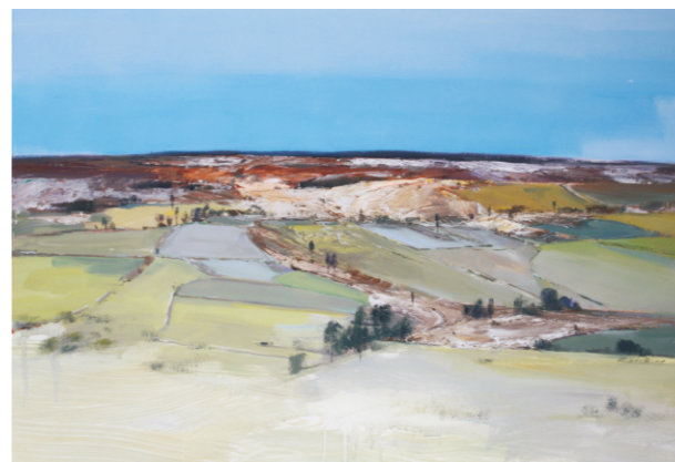
龚浩 雨后 纸本水粉

是个人风格形成的阶段，相信他的水粉画今后还会有第三个阶段。传统阶段主要是他美院毕业后大约10年左右的时间，他这一阶段的作品画幅相对较小，画面内容主要是表现一些乡间小景、山间溪流、农家小院等题材。从画法来看主要还是运用水粉画的传统技法，干画法与湿画法相互结合，水彩技法与水粉技法在他的写生与创作中得到了很好的运用。这一时期的水粉画作品色彩变化丰富，画家多用较小的色块与笔触层层覆盖来描绘景物，景物描绘深入细致，写实性强，表现出画家极强的写实能力。第二个阶段可以说是画家在水粉画上不断进行艺术探索与变化的时期，是他个人绘画风格逐渐成熟的时期。这一时期画家多次到欧美等国家进行艺术考察，并到国内的美术学院访学交流，进一步开阔了自己的艺术眼界。通过长期不断地写生创作逐渐形成了自己独特的水粉画风格。画家这一阶段的主要代表作品有入选第十二届全国美展的水粉画《雨后》、入选第十届全国水彩?粉画作品展的《古塬秋意》、以及《晚秋》等作品。画家这一阶段的作品在绘画材料、表现技法、画面意境等方面都已经发生了很大的变化。这些作品的画幅相对较大，构图整体而简洁，画面意境更加宁静、空灵，中国文人山水画的审美观念在这些作品之中表现得尤为突出。技法比前期作品更加的丰富多变，厚重之处如油画之凝重，薄处如水彩之透明。画家为了增加画面的厚重感解决水粉厚画法干后开裂的现象，他在水粉画颜料里加入了丙烯等不同材料，并根据画面的需要融入金粉或银粉，色彩沉着而明快。画家改变了以前使用小笔触、小色块的画法，多用大笔触、大色块、画面显得大气磅礴、空灵、宁静、意境深远，让人回味无穷。